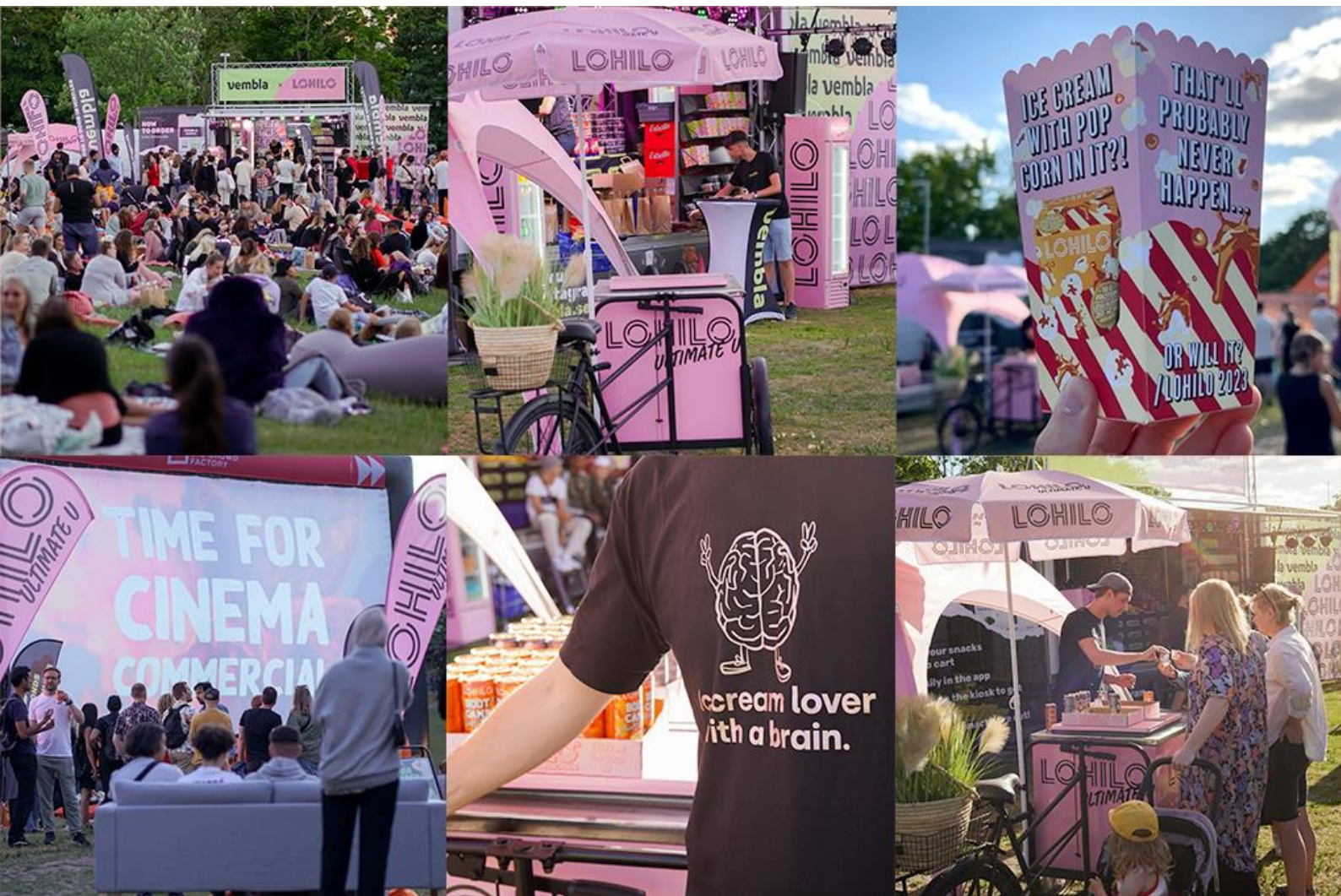
Bild nedan: Många har sett och hört talats om LOHILO men det är först efter att man smakat våra produkter som polletten verkligen trillar ner. Vi är av den anledningen ute på sommarturné med Europas största utomhusbiofestival. Med uppemot 50 000 besökare på våra 6 stopp i Sveriges största städer skapar vi långa köer till vår smakprovning av glass.