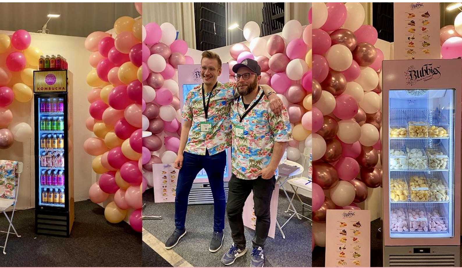
Bild nedan: Då vi är ett bolag med flera spännande varumärken i portföljen valde vi att på årets upplaga av Fastfood & Cafe & Restaurant Expo i Stockholm ställa ut med Bubbies glass och Kultures Kombucha, två varumärken vi ser tillväxt och stor potential i.